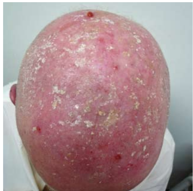
Figuur 1 Actinische keratosen