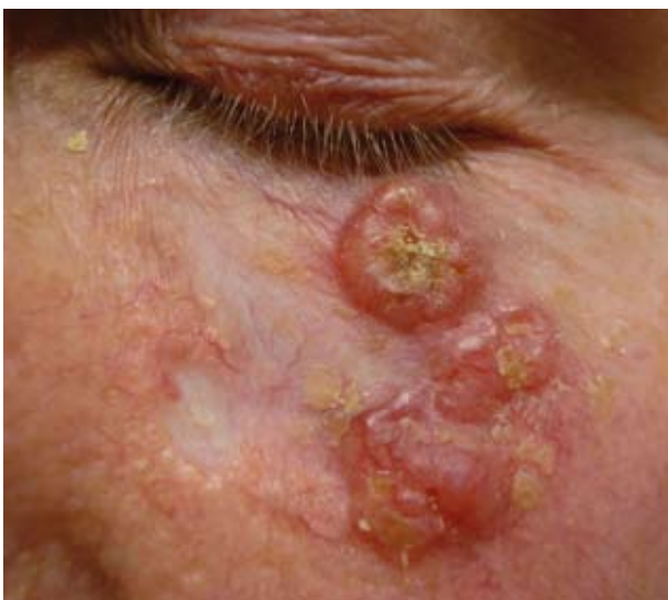
Figuur 2 Basaalcelcarcinoom